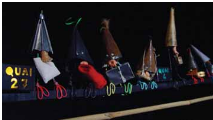
Je pars...