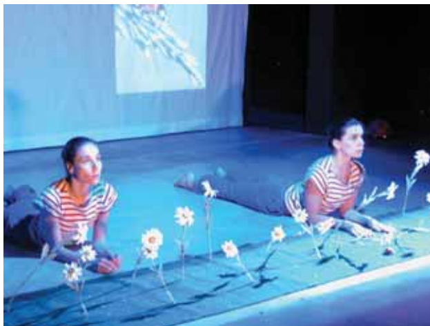
Du sirop dans l'eau