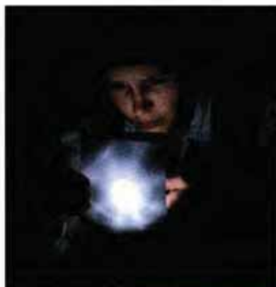
La reine des neiges