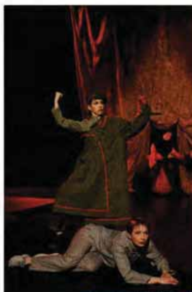
April 1996

théâtre forain, marionnettes âge tout public à partir de 4 ans durée 30 mn