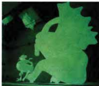
Aymeric Louis, Manifeste et Chimères

Ateliers de découverte des arts du cirque animés par les artistes pédagogues de Balthazar, pour les 6-12 ans : ateliers de jonglerie, d'équilibre, d'acrobaties au sol et d'aériens, pour les 3-5 ans : découverte du corps dans de nouvelles situations induites par les jouets du cirque. Les inscriptions aux ateliers se font sur place à partir de 13h30.