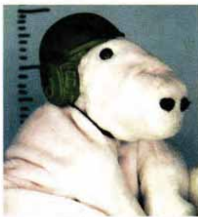
Dites-leur qu'on est partis © Editions JJ Maurin

Parc municipal dites-leur qu'on est partis (voir texte p.6) âge tout public à partir de 3 ans date samedi 20 mai à 16h30 et à 18h30 réservation 04 67 75 11 08