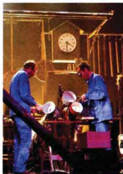
Brocante sonore

spectacle musical âge tout public à partir de 5 ans durée 50 mn