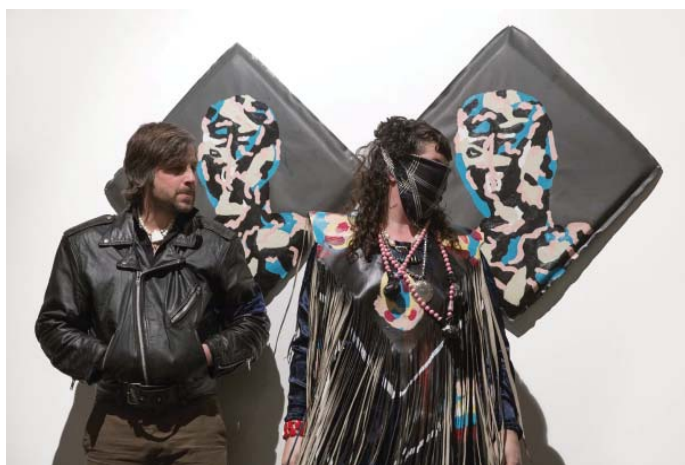
Ci-dessus : © Ivan Binet

Présentation de La Jamésie : https://www.youtube.com/watch?v=Rvm19ILBz14