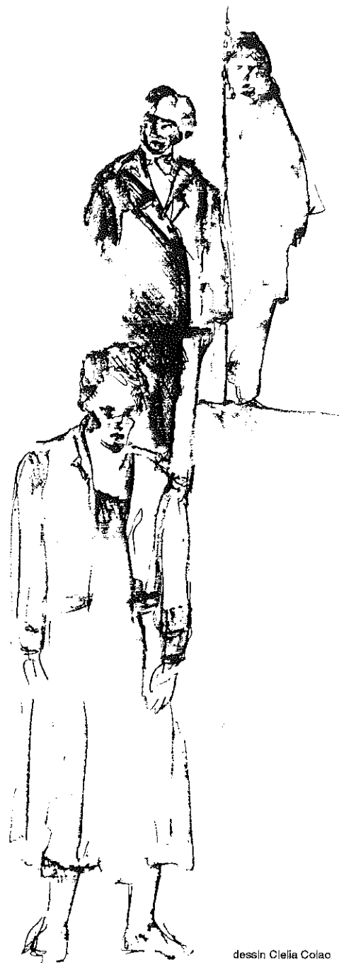
dessin Clelia Colao

Conseil donné aux acteurs, en exergue à Par les Villages .