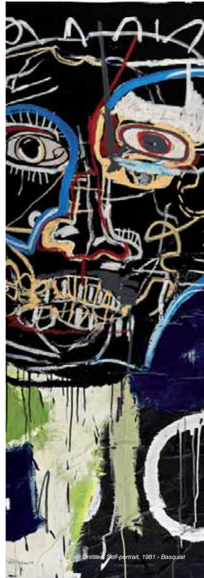
Untitled, Self-portrait, 1981 - Basquiat