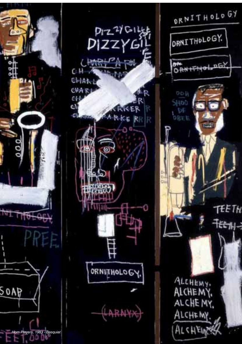
Horn Players, 1983 - Basquiat