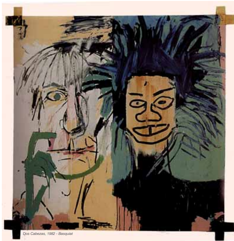
Dos Cabezas, 1982 - Basquiat

Témoignant de la rue, elles sont aussi des « portes d'entrée » possibles pour la vidéo au plateau.