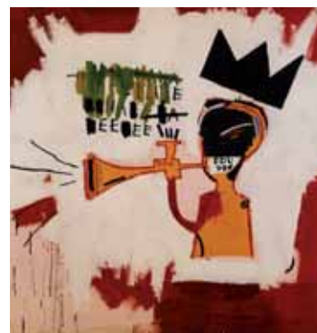
Impression glacée Trompette, 1984 - Basquiat

Blade travaille tout au long du spectacle à partir d'un "looper" sophistiqué, une machine permettant d'enregistrer et de retravailler en direct les sons et les voix. Ainsi, en plus d'une partition musicale que nous prendrons le temps de construire tout au long des répétitions, nous avons aussi souhaité accorder une place à l'improvisation musicale « en direct ».