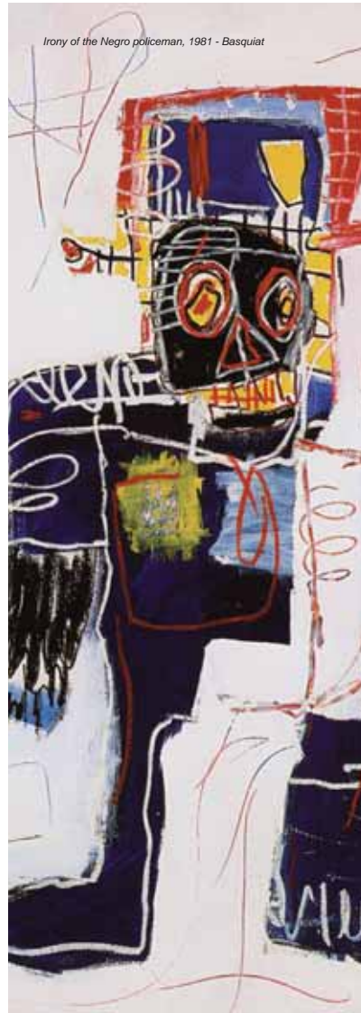
Irony of the Negro policeman, 1981 - Basquiat