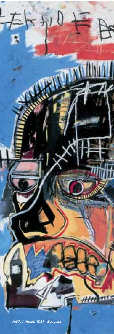
Untitled (Head) 1981 - Basquiat