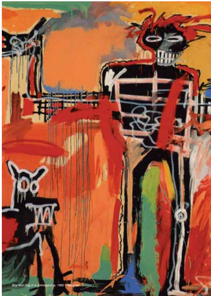
Boy and Dog in a Johnypump, 1982 - Basquiat