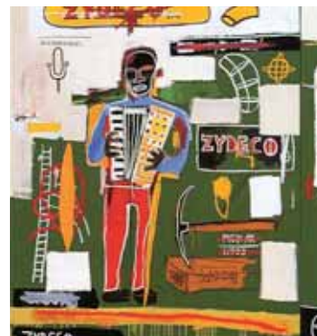
Zydeco - Basquiat