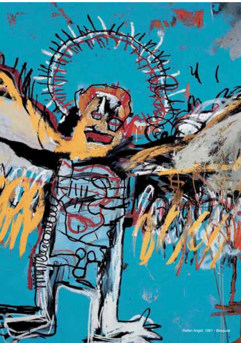
Fallen Angel, 1981 - Basquiat