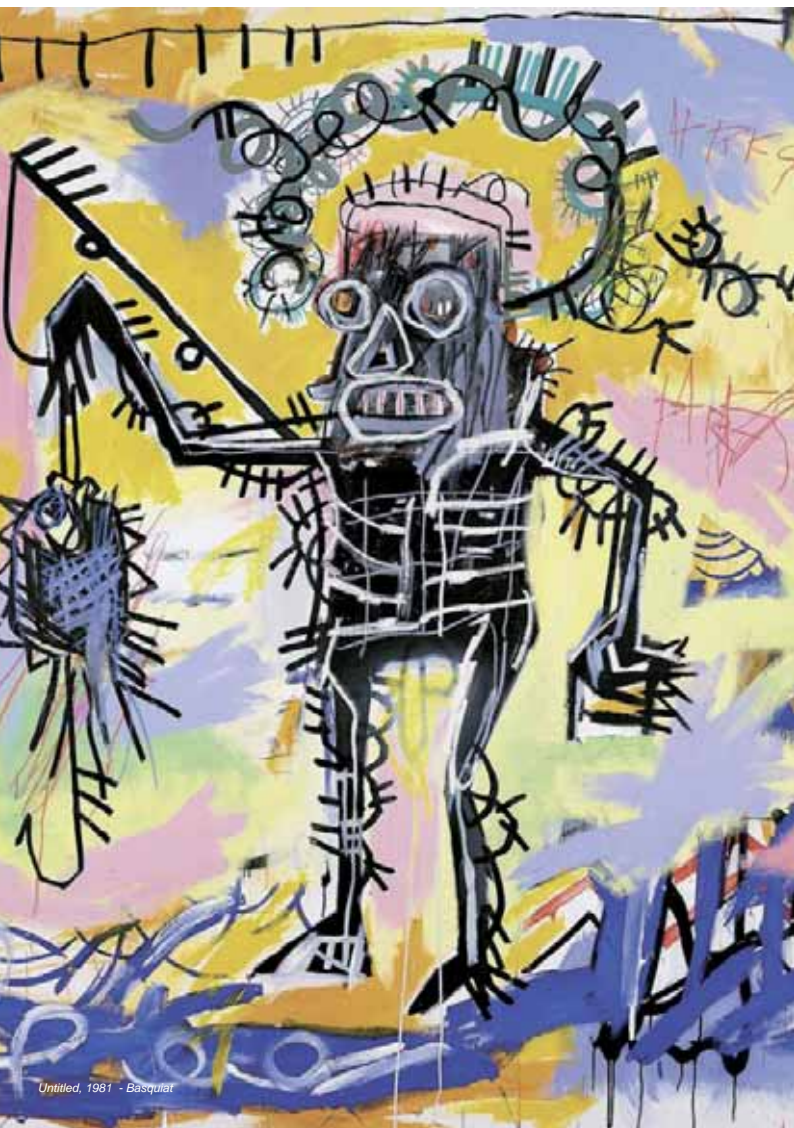
Untitled, 1981 - Basquiat